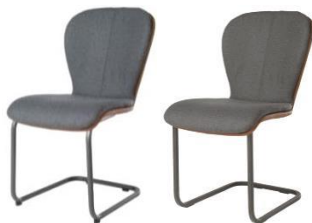
614C Komfort (rund)

Blake 614C / 617C Komfort - Bi-Color Mattenpolsterung* Matte