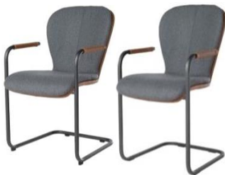
624C Komfort (rund) 627C Komfort (eckig)

Blake 624C / 627C Komfort - Bi-Color Mattenpolsterung* Matte